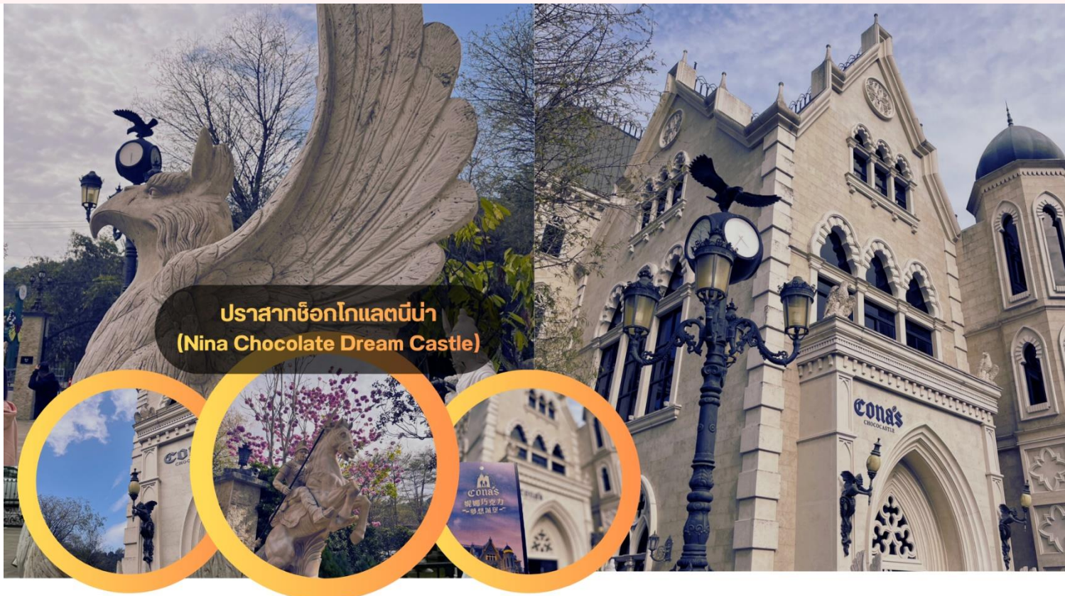
ปราสาทช็อกโกแลตนิน่า (Nina Chocolate Dream Castle)

พาท่านเสริมสิริมงคลที่ วัดเหวินหวู่ (Wenwu Temple) วัดศักดิ์สิทธิ์ที่สุดแห่ง "สุริยันจันทรา" สัมผัสพลังความศักดิ์สิทธิ์ที่รวมเทพเจ้าฝ่ายบุนและปู้ไว้ในที่เดียว! ขอพรเรื่องสติปัญญาและการเรียนจาก ท่านขงจื้อ พร้อมขอโชคลาภ การงาน และความซื่อสัตย์จาก เทพเจ้ากวนอู นั่นจากนี้วัดแห่งนี้ยังมีจุดสถานที่ของความขลังและพลังอันศักดิ์สิทธิ์ เริ่มจากหน้าวัดมีสิ่งโตหินอ่อนสีแดง คู่ยักษ์หน้าวัดที่ใหญ่ที่สุดในไต้หวันเพื่อปัดเป่าสิ่งชั่วร้าย. บันได 366 ขั้น: เปรียบเสมือนจำนวนวันใน 1 ปี (รวมปีอธิกสุรทิน). กระดิ่งขอพร: นักท่องเที่ยวนิยมซื้อกระดิ่งตามปีนักษัตร เขียนคำอธิษฐานแล้วนำไปแขวนไว้ตามชั้นบันไดวันเกิดของตน. วิหาร 3 ชั้น: แบ่งเป็นวิหารหน้า (เทพเจ้าแห่งโชคลาภ), วิหารกลาง (เทพเจ้ากวนอูและจ๊กฮุย) และวิหารหลัง (ท่านขงจื้อ).